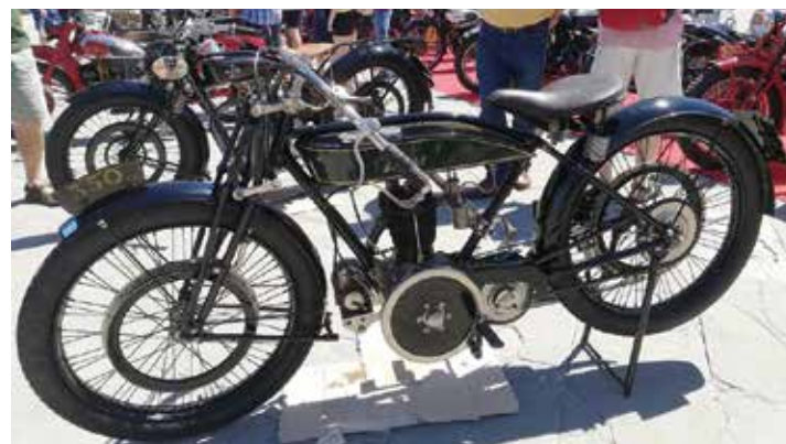
Due "sottocanna" degli anni '20. La "Veros 350" da corsa prodotta in Italia dalla ditta Garanzini con motore Blackburn. A fianco una belga FN.