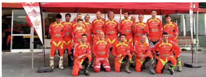
Una parte della squadra di Enduristi del MC Trieste ad inizio stagione 2019.