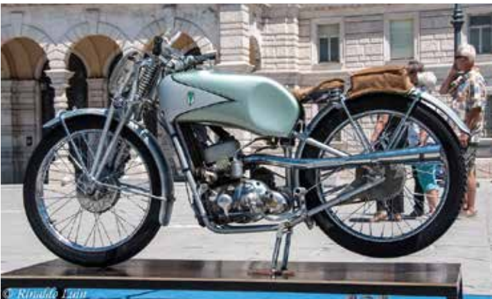
Dal Museo di Vransko la DKW SS 250 da corsa, 2T raffreddato ad acqua, supervincente dal 1938 ai primi anni '50.