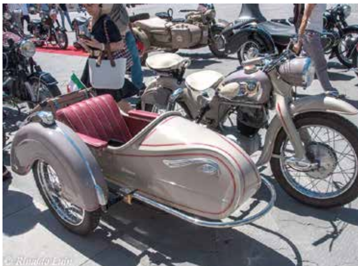
Il perfetto restauro della NSU Max 250 con sidecar, anni '50.