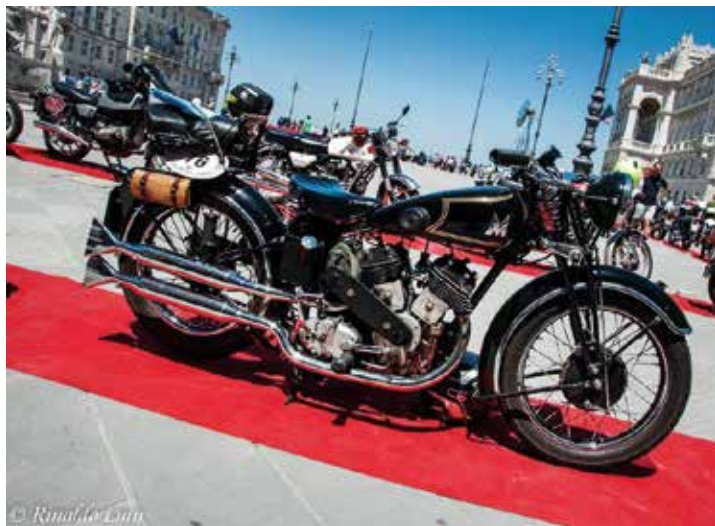
La Matchless "Silver Hawk" dei primi anni '30, motore bicilindrico a V longitudinale da 600cc, macchina di grande prestigio.