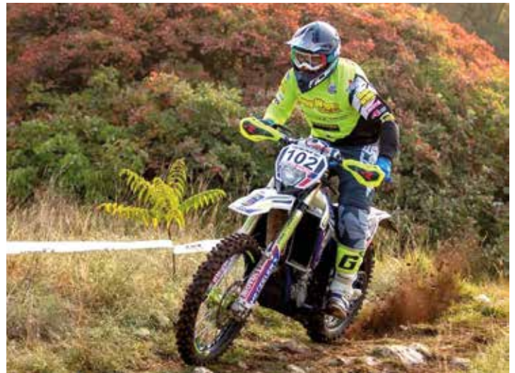
Collovigh, Campione Triveneto e Regionale, quarto nel tricolore Juniores.