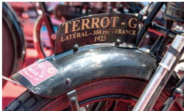
La tabella tagliavento sul parafango anteriore della francese Terrot, bel motociclo del 1923.