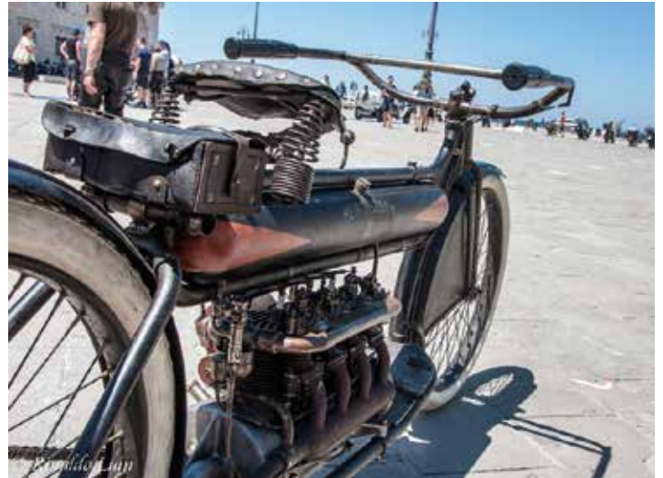
L'americana Henderson 1000 a 4 cilindri in linea (1912-15) presente a Trieste, uno dei pochi esemplari al mondo in questo stato di originalità.