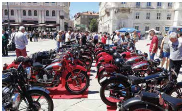
In mezzo alla piazza tante belle Guzzi, oltre alle Gilera e Benelli, ma anche le prestigiose Rudge e Vincent HRD.

de personaggio, figlio della città giuliana - inaugurata quel giorno è stato un fiore all'occhiello che ha portato a Trieste il gotha del giornalismo di settore e non solo. Ci sarebbe molto da dire su quella giornata firmata Moto Club Trieste ma in questa sede, in cui possiamo solo riassumere un'annata importante, lasciamo parlare le immagini, giusto per ricordarci dei vari momenti di quella occasione, continua