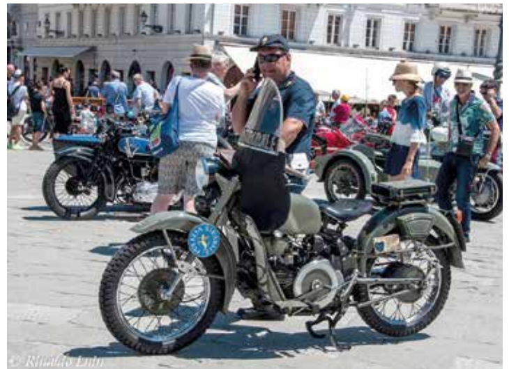
Presente anche la Polizia di Stato, collaboratrice dell'organizzazione. Lagente presidia la Guzzi Falcone 500 della Polstrada (primi '60).

loro conduttori venuti dai due emisferi sono giunti, provenienti da Croazia e Slovenia, alla giornata italiana, quella conclusiva del Fiva World Motorcycle Rally, in Piazza dell'Unità d'Italia dove si sono aggiunti al centinaio di splendidi esemplari dei collezionisti italiani e locali che hanno aspettato e accolto quello straordinario museo viaggiante. Col Comune di Trieste, col sostegno della Fondazione CRTrieste, con