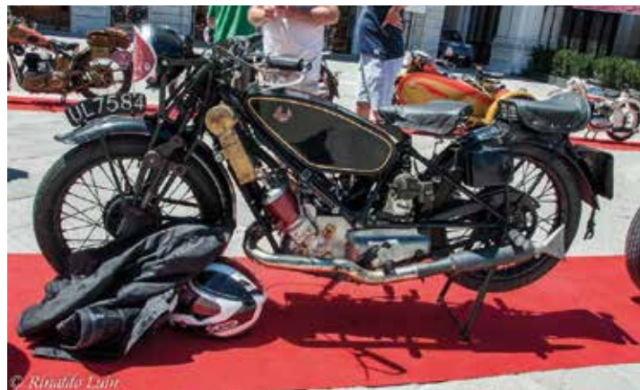
La Scott "Flying Squirrel", 1926 - '39, motore bicilindrico 2T 600 cc, raffreddato a liquido, fattezze eleganti, leggera, veloce e stabile.