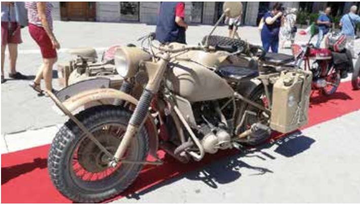
La BMW R75 (1939), side tattico e armato, con trazione anche sulla terza ruota, ridotte, blocco del differenziale.