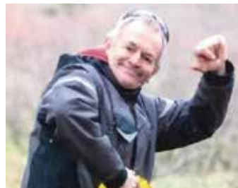
"Super Pildo" aiutante di campo.