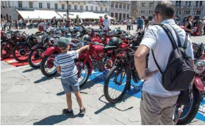
È significativo che sia un bambino l'ammirato osservatore di quelle "nonne" della meccanica convenute a Trieste da tutto il mondo.